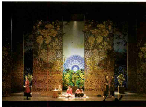
« Siroe re di Persia »